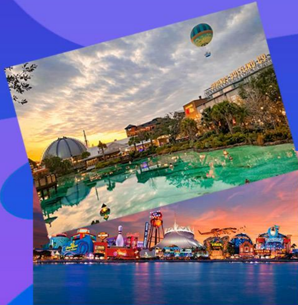
Tour Disney Spring