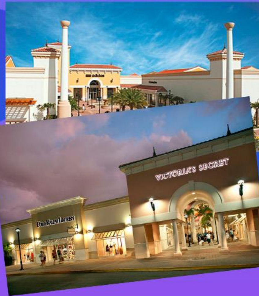
Tour de Compras no OUTLET PREMIUM INTERNACIONAL DRIVE