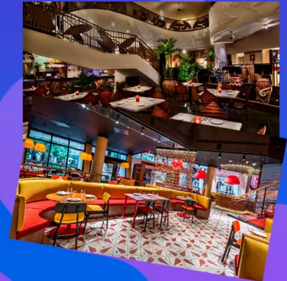
Jantar exclusivo com a Rádio Disney